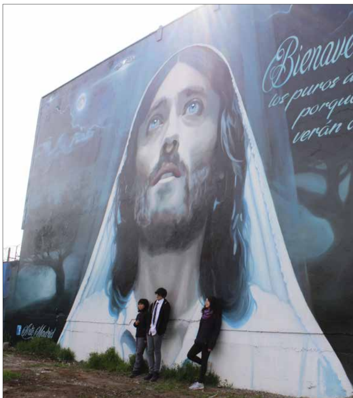
DIARIO EL DIAMANTE ESCONDIDO

• Se espera que tras el nuevo eje que une Lo Marcoleta con Ruta 5, artistas de la comuna lo llenen de color.