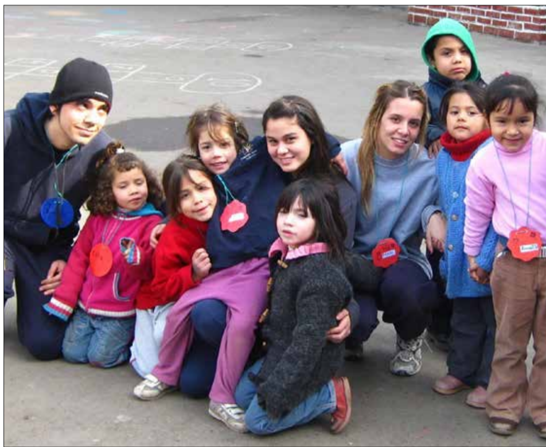
Colonias de Invierno: Corporación Pilares de Esperanza realiza encuentros con los niños de la comunidad durante vacaciones de invierno y verano.