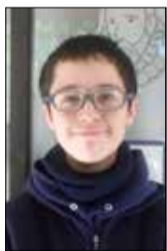
Por Gustavo Barraza

Los jóvenes de hoy leemos literatura como Divergente o Los juegos del hambre, sin embargo algunos creen que la lectura actual perjudica en los estudios y nos aleja de los autores clásicos como William Shakespeare y Homero.