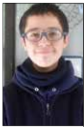
Por Gustavo Barraza

Este año tenemos elecciones presidenciales. Sin embargo, me preocupa que los ciudadanos voten por mera simpatía, y no por la calidad de las propuestas.