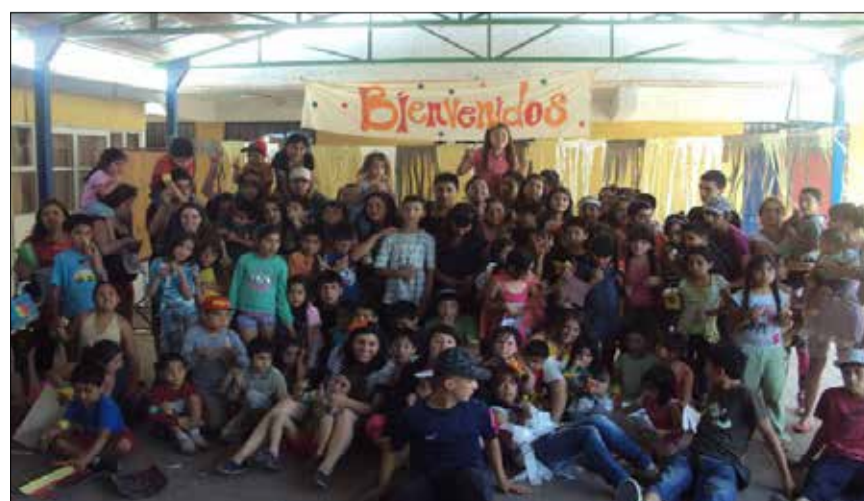
CORPORACIÓN PLANES DE ESPERANZA

• Hoy la población Parinacota se proyecta como una comunidad organizada gracias al esfuerzo de sus vecinos y cambios profundos.