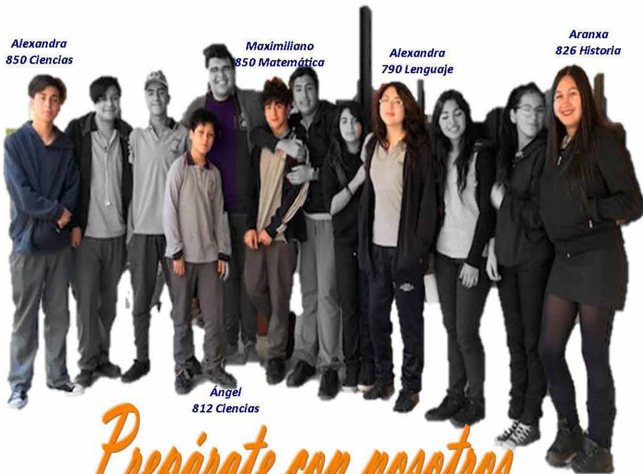
Aranxa 826 Historia