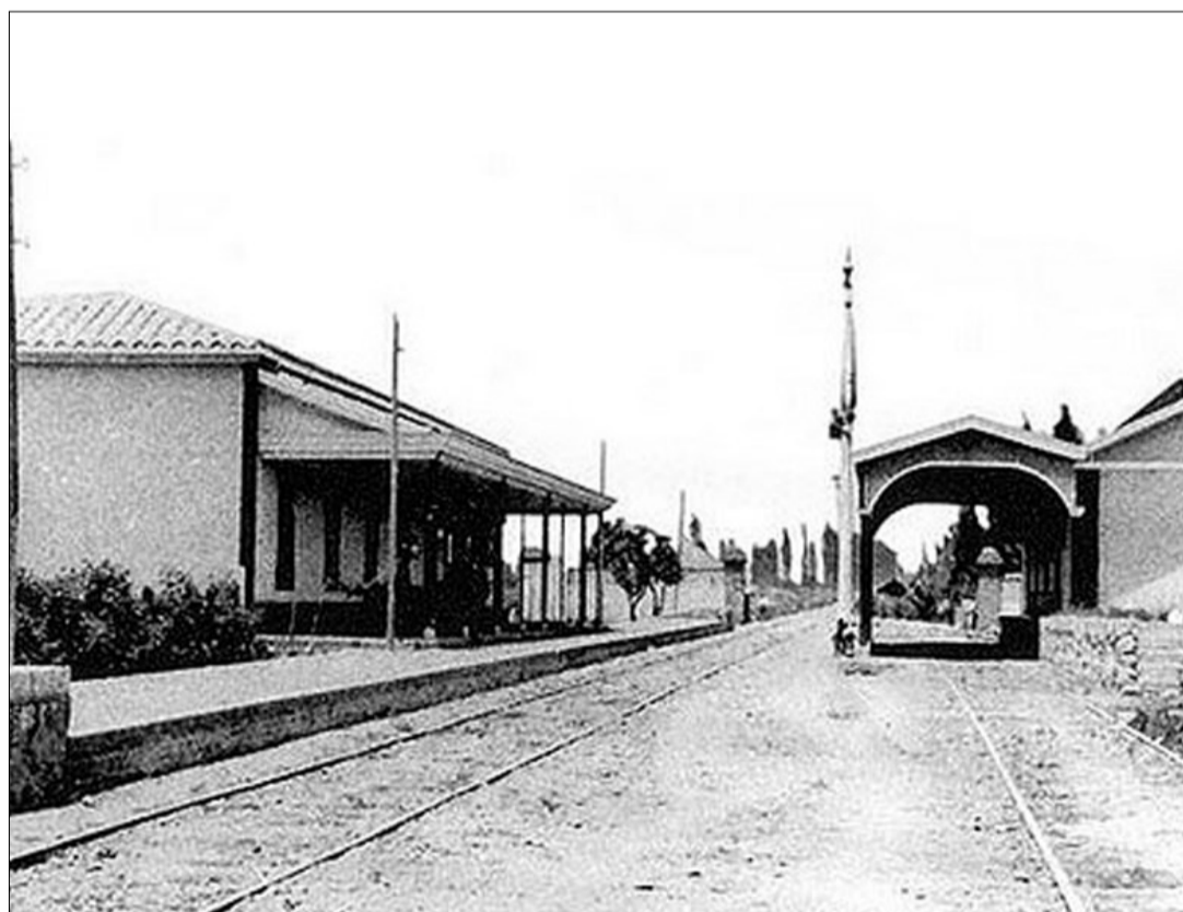
Estación de Quilicura siglo XX, única conexión con la comuna.

"Hoy es impactante ver la cantidad de gente que transita, las industrias, la contaminación, sin nombrar el hacinamiento, la