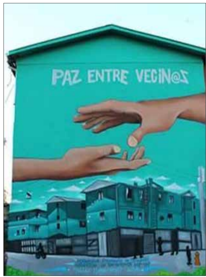
Desde talleres a intervenciones: Diferentes grupos de pobladores se reúnen para crear proyectos que mejoren la vida en la Parinacota.

“Yo pienso que la población está mejorando. Ya no hay tanta