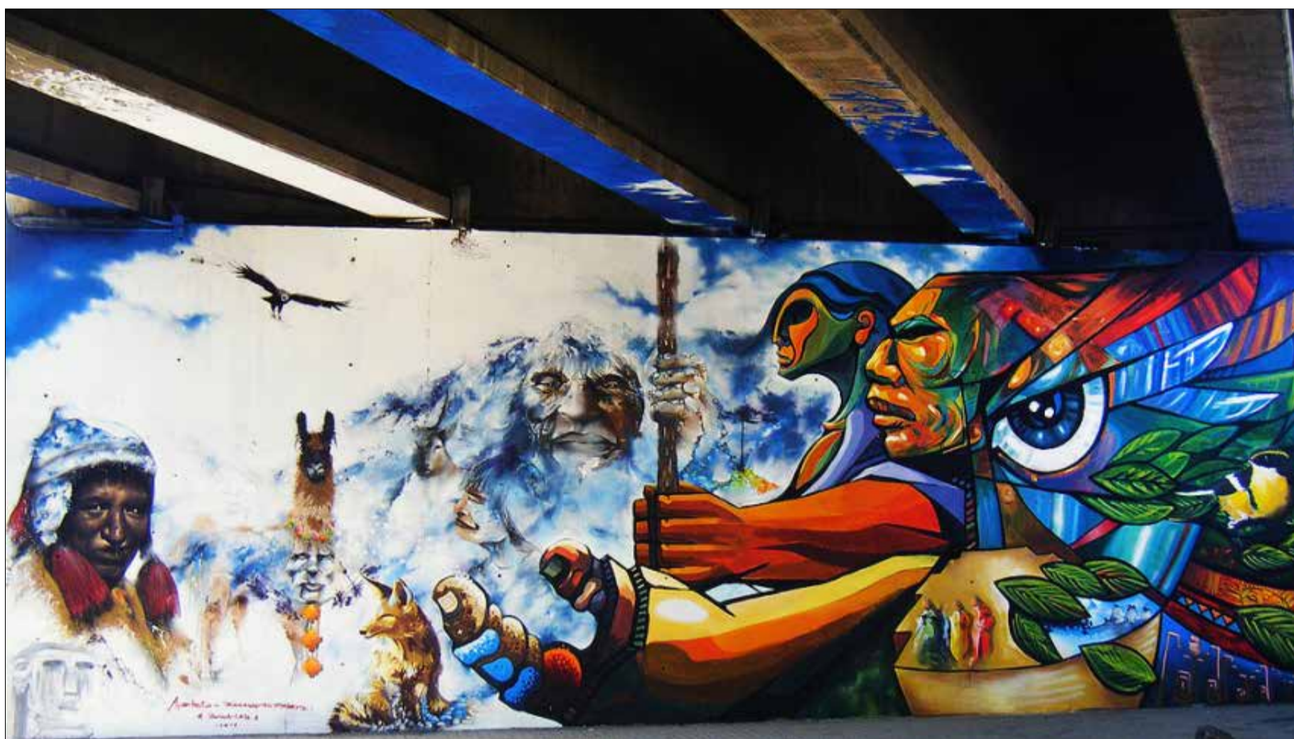
"Mural NAO - DEGRA - TE / RED APACHETA (Bolivia) 2011: Colectivos compuestos por artistas latinoamericanos se reunieron para dar vida a la intersecciones de la comuna".