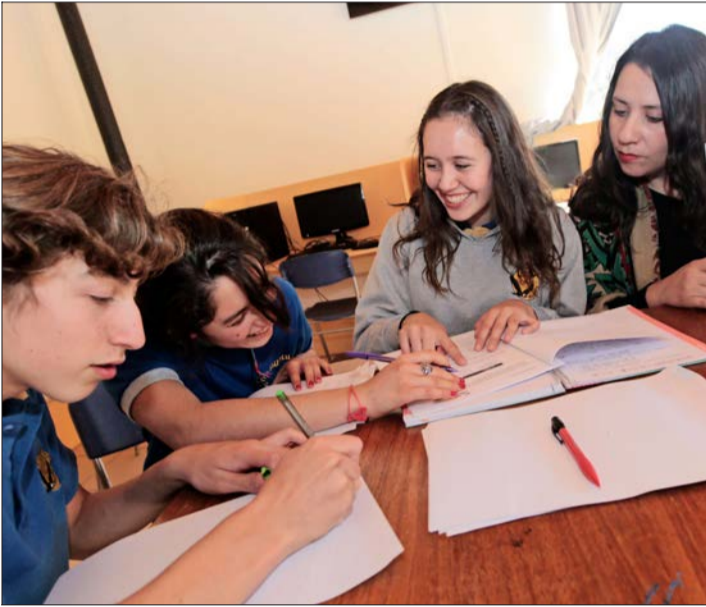
Los alumnos de enseñanza media del Colegio Montessori Millantú, de Villa Alemana, disfrutaron elaborando su diario local, La Luz del Tiempo.

El programa cuenta con el apoyo de Cpech y Movistar.