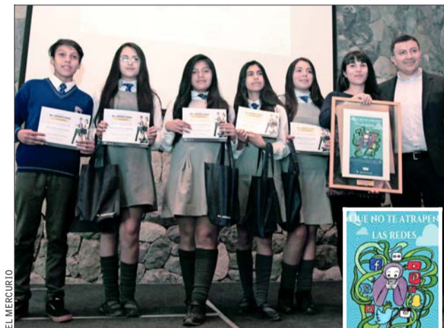
Equipo del Colegio Divina Maestra de Villa Alemana, ganadores del premio a la mejor publicidad Movistar (imagen de la derecha).

La forma de mostrar el mensaje en el afiche se les ocurrió a los chicos. Es interesante cómo tienen una mirada más crítica y reflexiva sobre su entorno y las cosas que están pasando en el país".