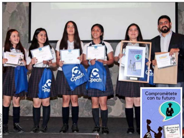
Equipo del Colegio Adventista Maranata de Talca, ganadores del premio a la mejor publicidad Cpech (imagen de la derecha).