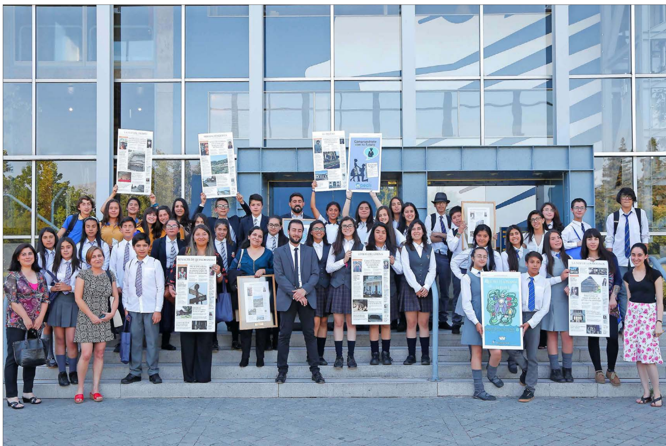
Alumnos y profesores guía muestran portadas y páginas ganadoras de sus diarios durante la premiación de la XIV versión de El Mercurio de los Estudiantes, en la que fueron destacados como los mejores periodistas escolares del país.