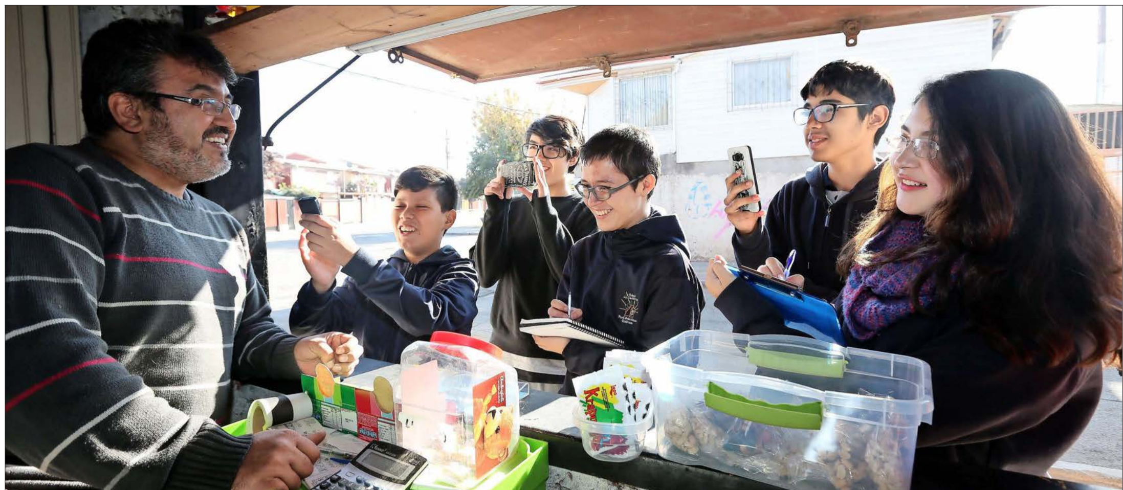
El equipo del diario escolar del Colegio Juan Luis Undurraga Aninat, de Quilicura, ganó el primer lugar en la categoría de enseñanza básica en el concurso de periodismo escolar.

Ganadores de El Mercurio de los Estudiantes 2017: