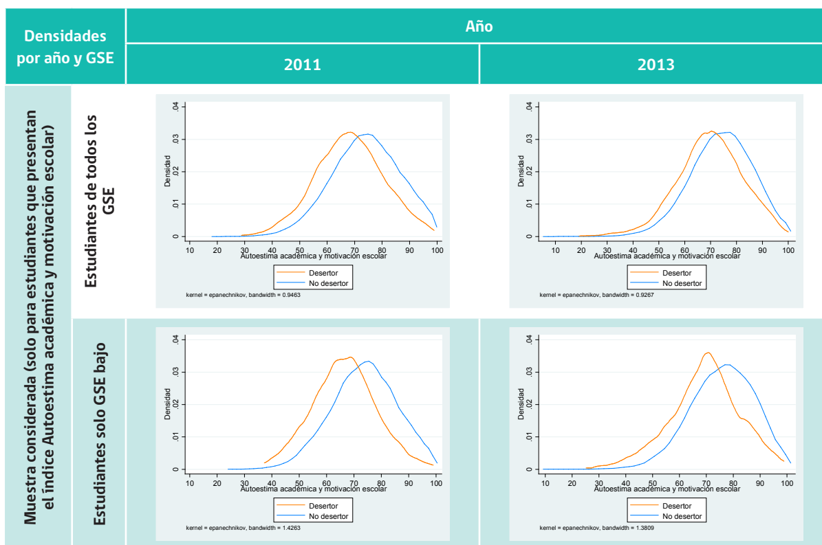
Figura 2.1 Comparación de las densidades del índice de Autoestima académica y motivación escolar en alumnos de 8º básico 2011 y 2013 que al año siguiente son desertores o no desertores