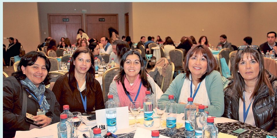
Jornada de directores en Osorno.