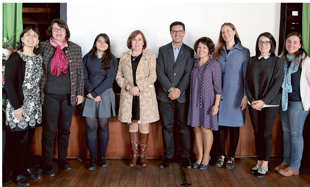
Representantes del Mineduc, del Sistema de Aseguramiento de la Calidad, de la Agencia de Calidad y del Liceo República de Brasil.

Uno de los grandes logros de la Agencia ha sido generar un cambio en la mirada de calidad, que se traduce no solamente en la disminución de la aplicación de pruebas estandarizadas, las que