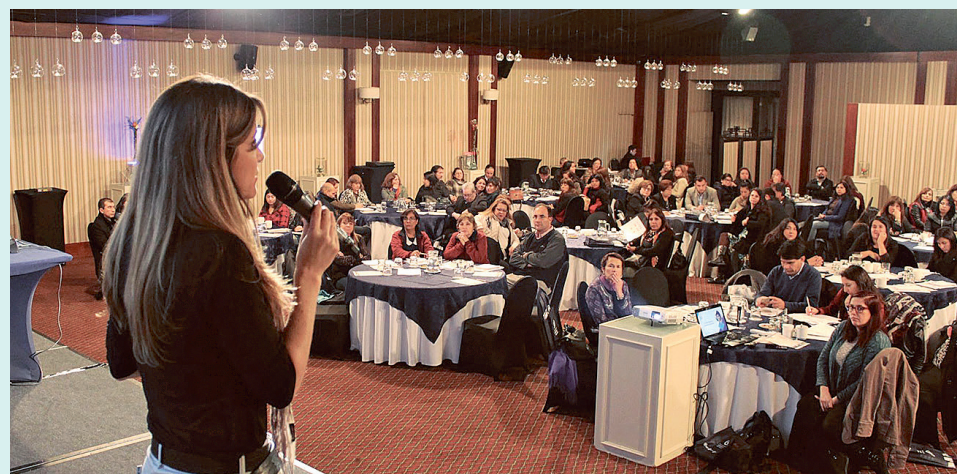
Jornada de Evaluación Progresiva en Santiago.